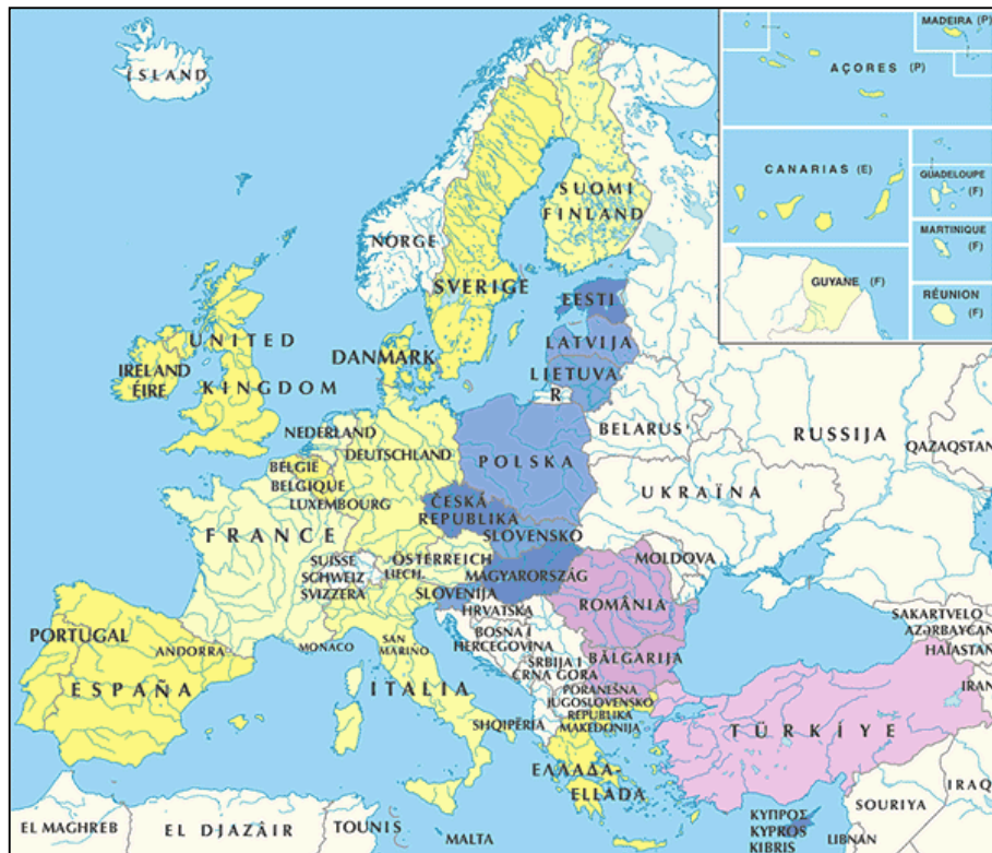
Diagramme 456 – L'Union Européenne